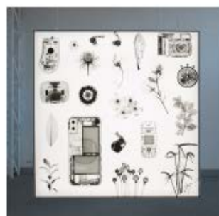
Flatlandia - Studio Binocle, Bar Assab - Matilde Cassani Studio, Il codice della quinta stagione - Parasite 2.0

La mostra resterà aperta fino al 22 marzo 2025 dal mercoledì al venerdì dalle 15:00 alle 19:00 , sabato su appuntamento